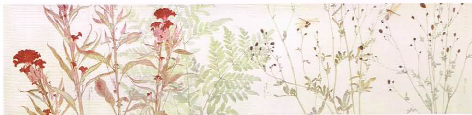
荻生天泉《花卉虫鳥類写生図巻》1921年