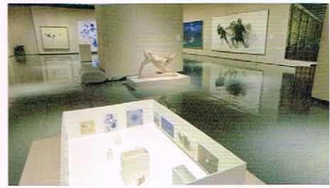
昨年度の展示風景