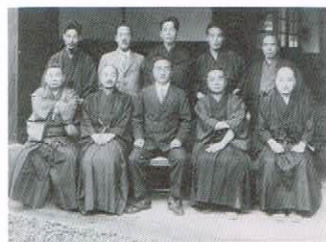
1919年 福陽美術会結成時の写真